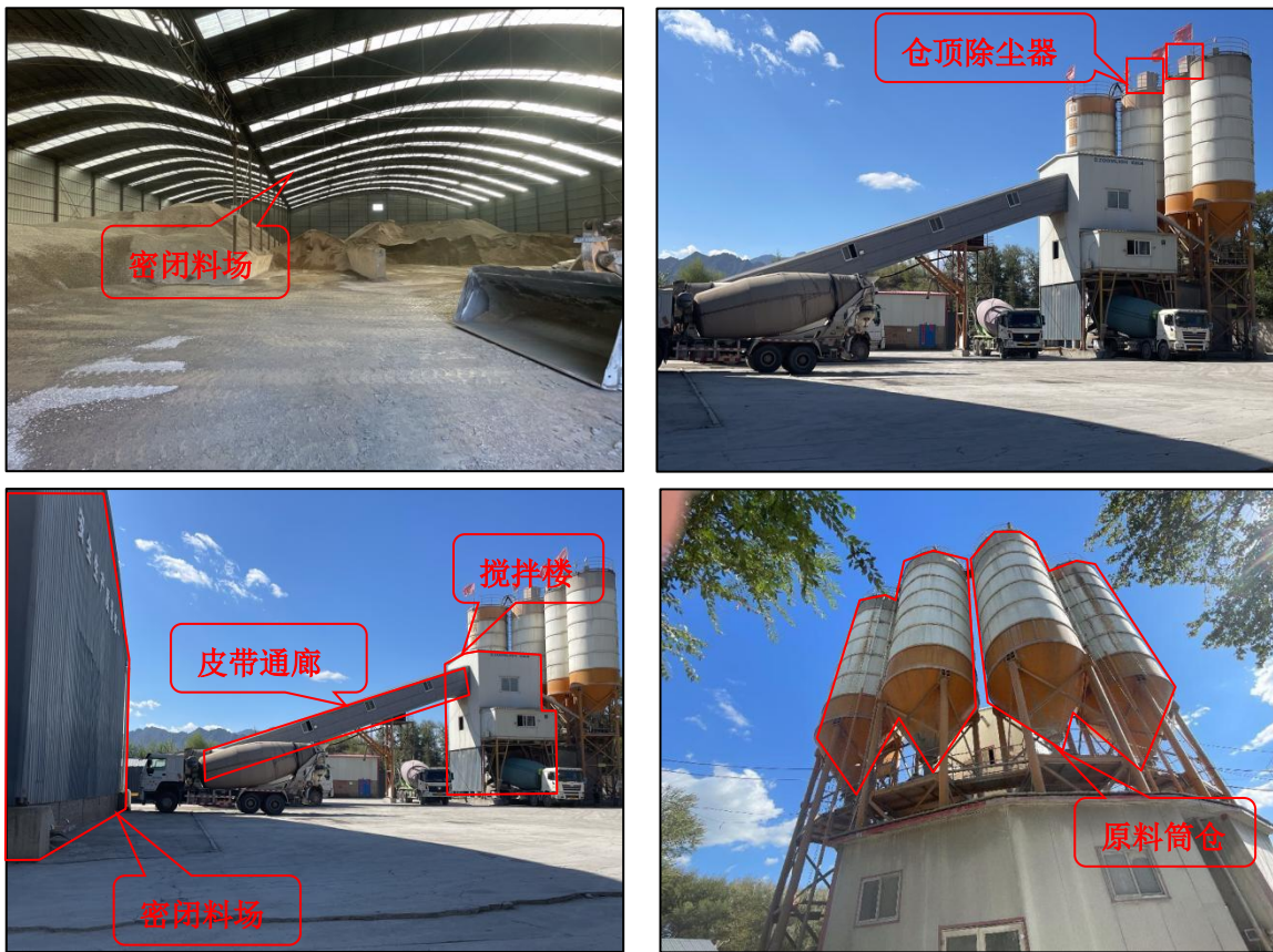
图 4-1 现场勘察情况