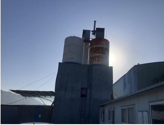
筒仓及仓顶除尘器

不同粒度的重钙粉，符合粒度的重钙粉经风机作用通过管道进入旋风收集器内进行分离收集，收集后经提升机提升至筒仓最后灌装呈 50kg/袋成品并存放于库房。