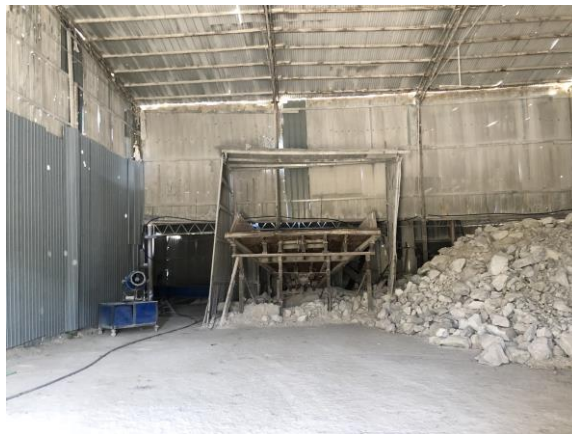
封闭库房及雾炮机