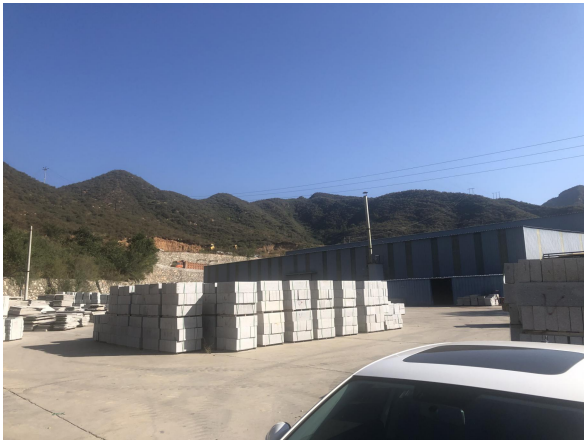
车间密闭及地面硬化