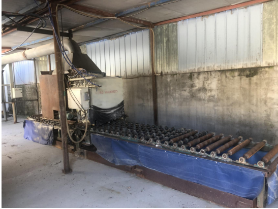
火烧板机上方集气罩