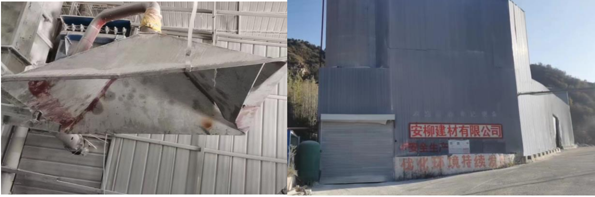
破碎机上方集气罩